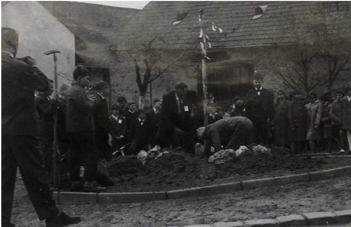
sázení Lípy osvobození