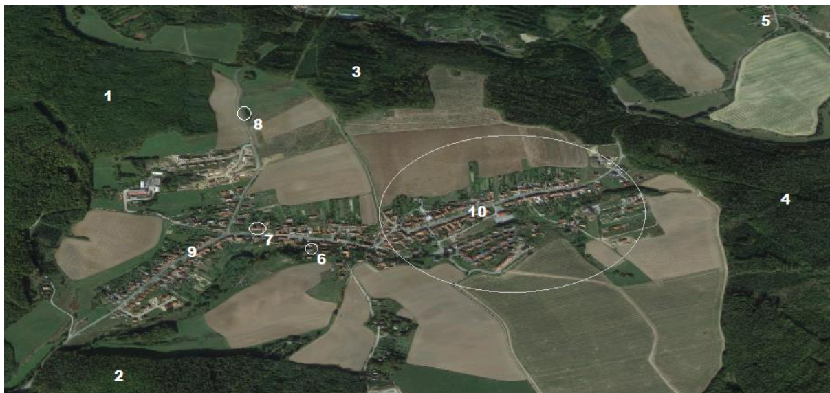
mapa obce Březina