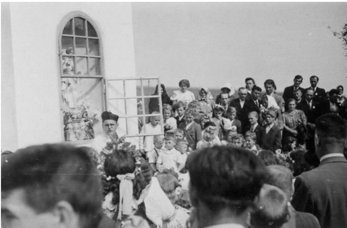
svěcení Božích muk