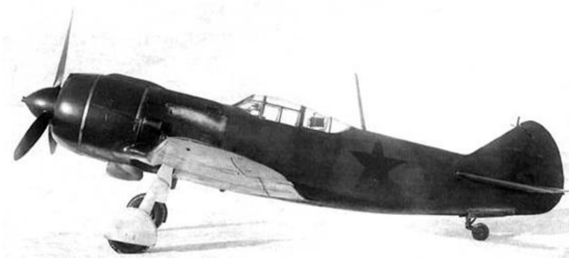
jeden ze sovětských letounů Lavochkin La-7, jež operovaly na území Moravského krasu