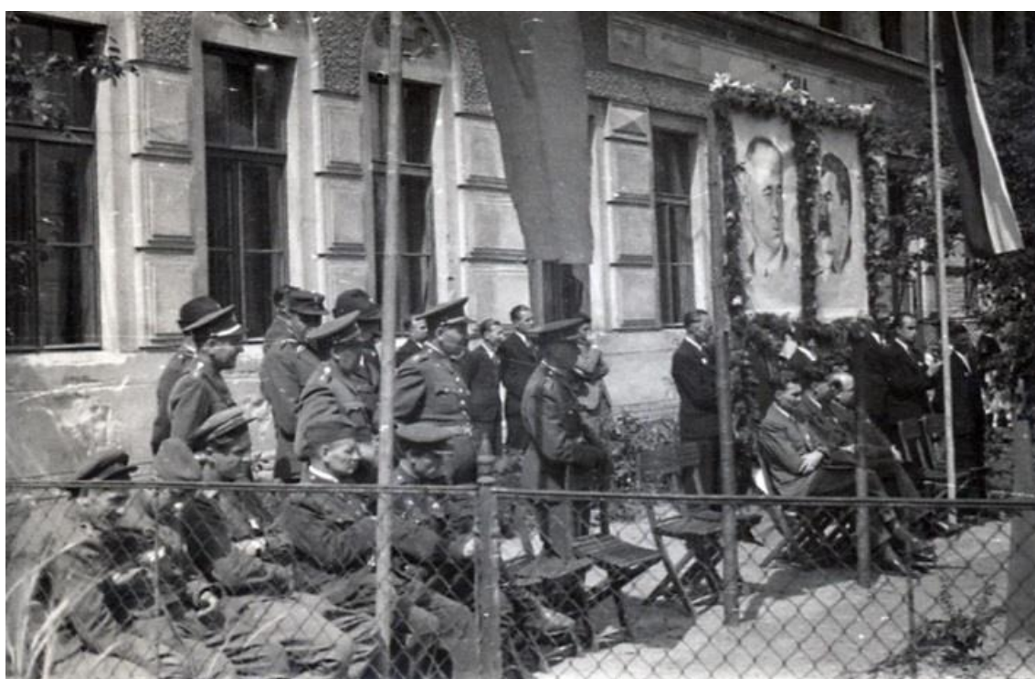
slavnostní pohřeb padlých vojáků Rudé armády